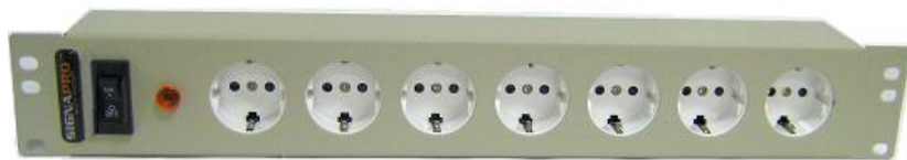
Рисунок 2. Монтажно-габаритные размеры блока розеток REC- S716A