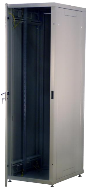
Рисунок 1: Внешний вид

Новая серия шкафов Alpha (см. Рисунок 1) позволяет оптимизировать затраты на проектирование и создание распределительных центров. Отличительные черты моделей этой серии: